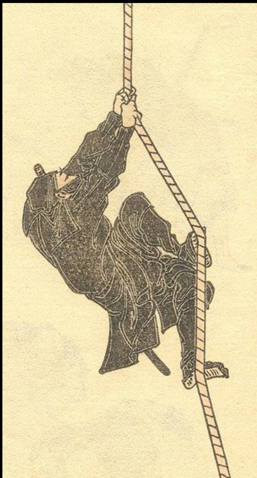
Drawing of the archetypal ninja from a series of sketches ( Hokusai Manga ) by Hokusai. Woodblock print on paper . Volume six , 1817.