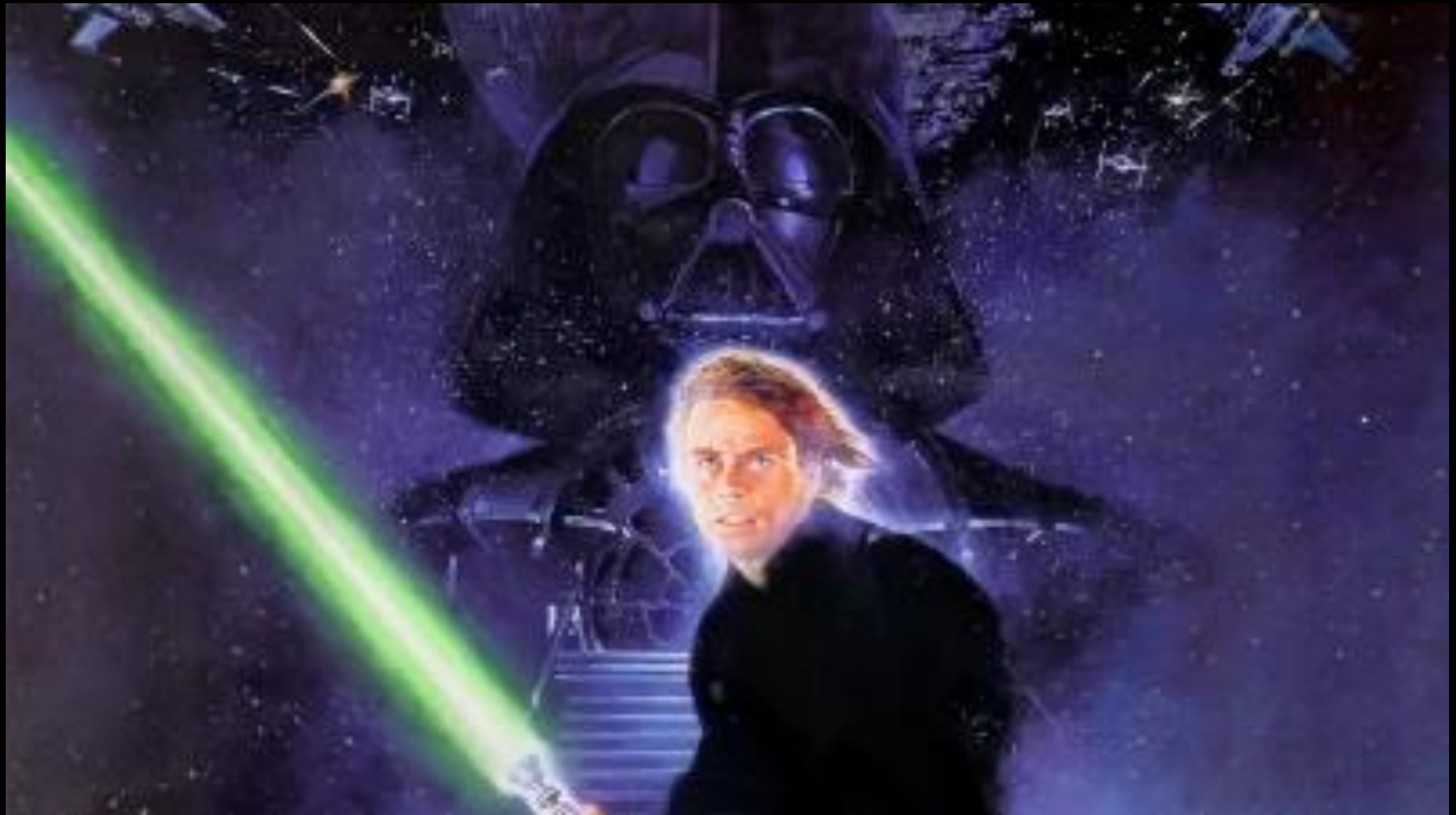
(«Star wars»).